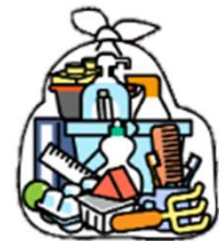
「プラスチック専用袋」 に入れて集積所に出す