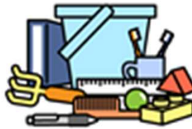
プラスチック製品