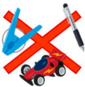
金属を含んだもの