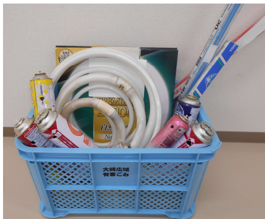
▲有害ごみ専用ボックス