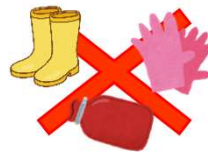
ゴム・シリコン製品