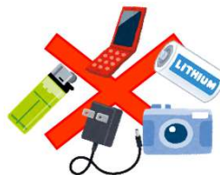
小型家電・ 発火の危険性があるもの